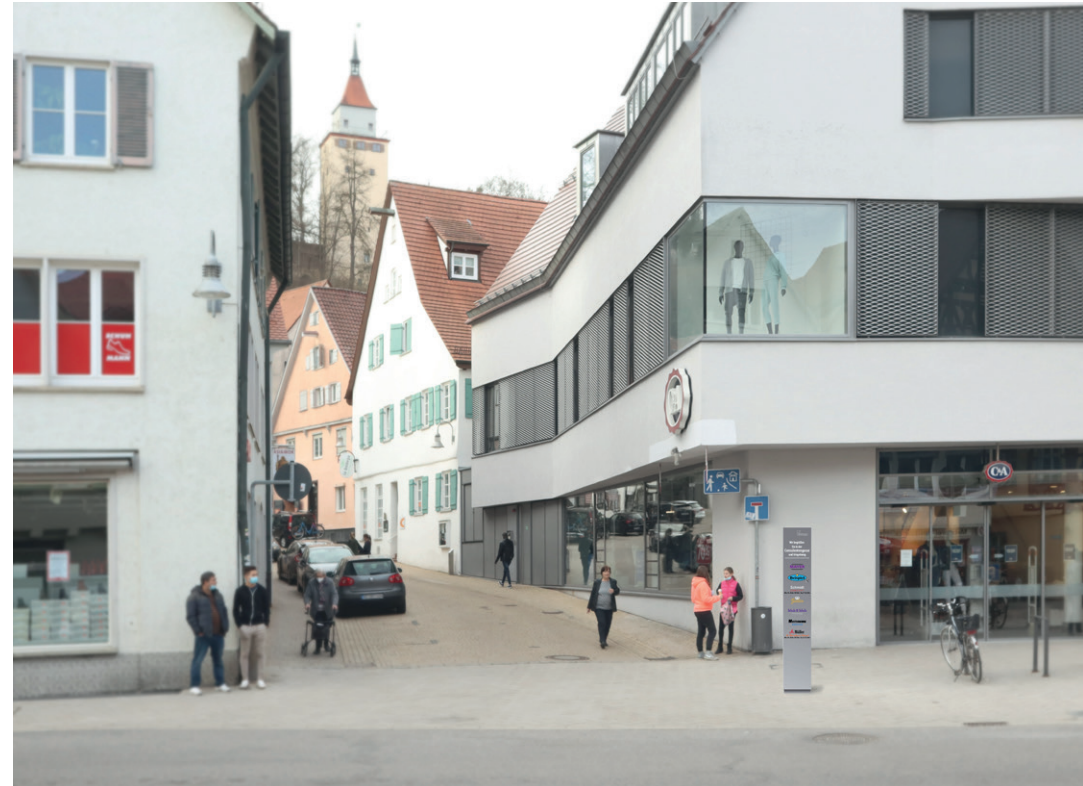
Visualisierung: freistehende oder wandmontierte Variante (Beispiel Weberberg)