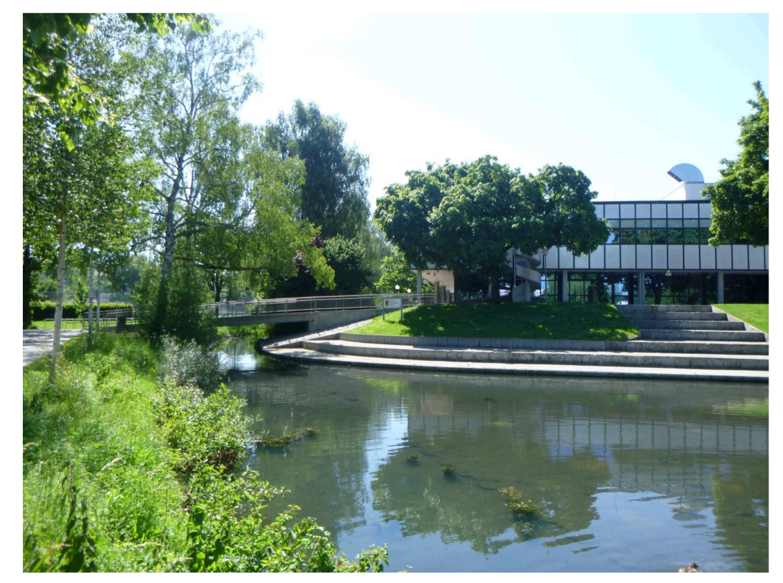
Bestandsbild Schwarzer Bach, See