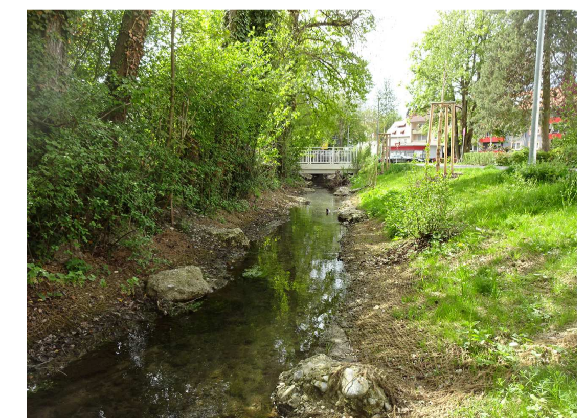
Leitbild Schwarzer Bach nach Renaturierung 2018, Schwarzbachstraße, südlicher Teil