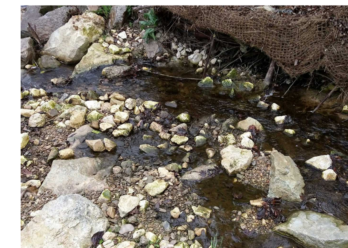
Ausbildung eines Niedrigwassergerinnes