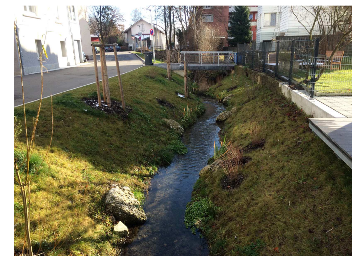
Leitbild Schwarzer Bach nach Renaturierung 2018, Schwarzbachstraße, nördlicher Teil