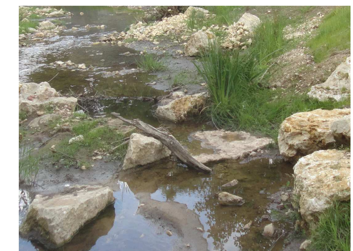
Strukturreiche Sohl- und Ufergestaltung