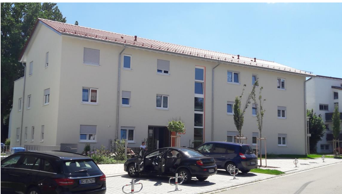
( Hans-Rohrer-Straße 23 )