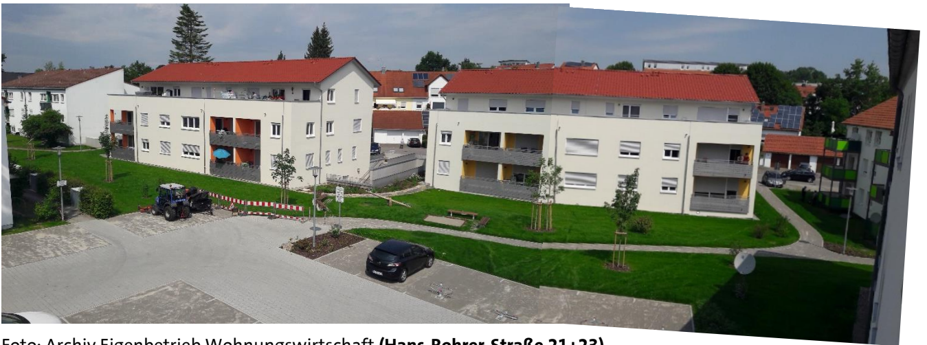
Foto: Archiv Eigenbetrieb Wohnungswirtschaft ( Hans-Rohrer-Straße 21+23 )