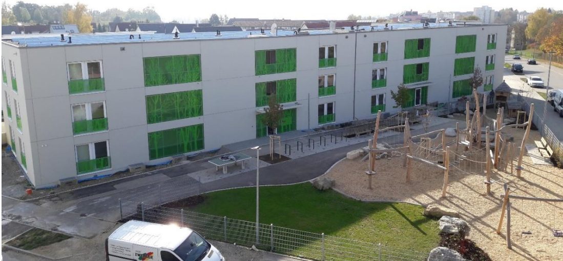
( Hochvogelstraße 50 )