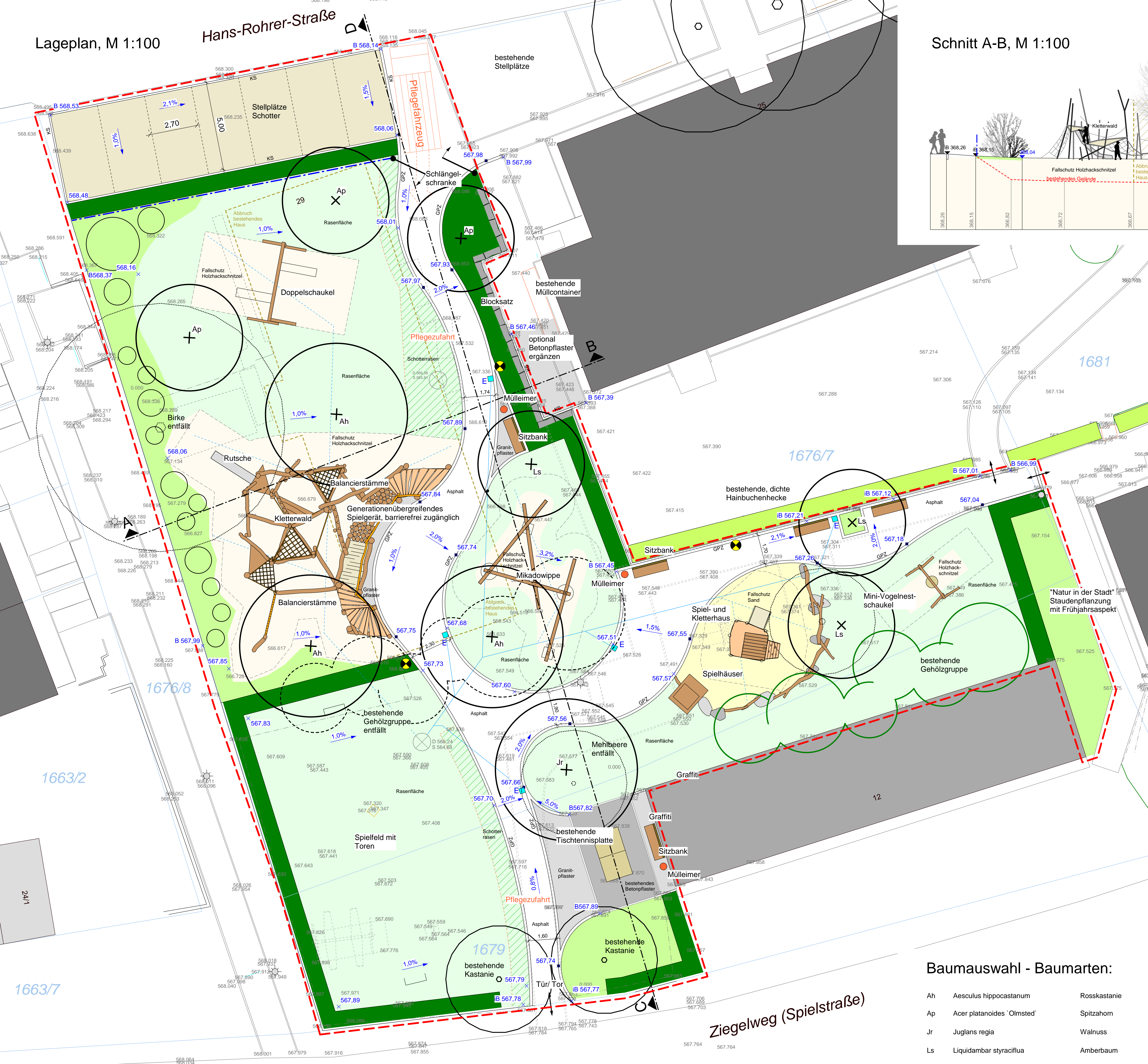
Schnitt A-B, M 1:100