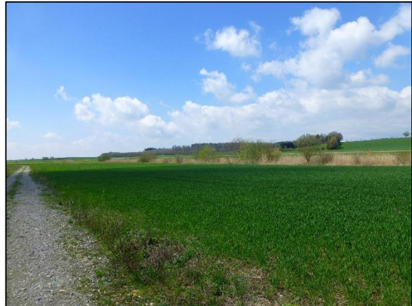
Abb. 6: Blick Richtung Süden mit Wirtschaftsweg und Acker sowie Neuweihergraben