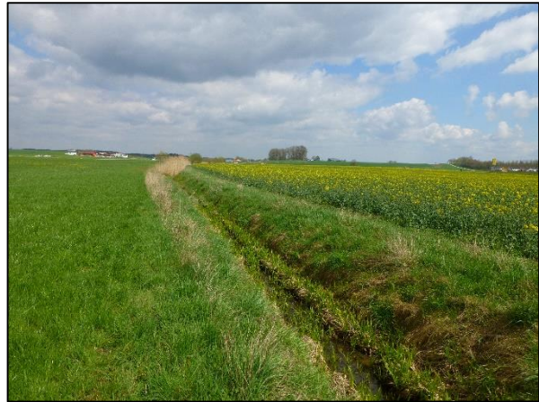
Abb. 4: Neuweihergraben Blick Richtung Norden