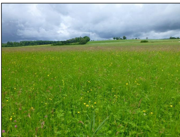
Abb. 7: Grünland westlich des Neuweihergrabens mit Blick Richtung Landebahn des Flugplatzes