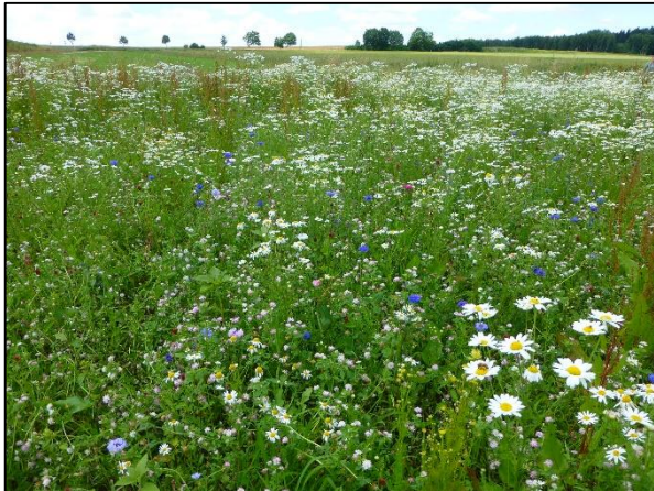
Abb. 5: Ackerbrache mit Ansaat von Blümmischung