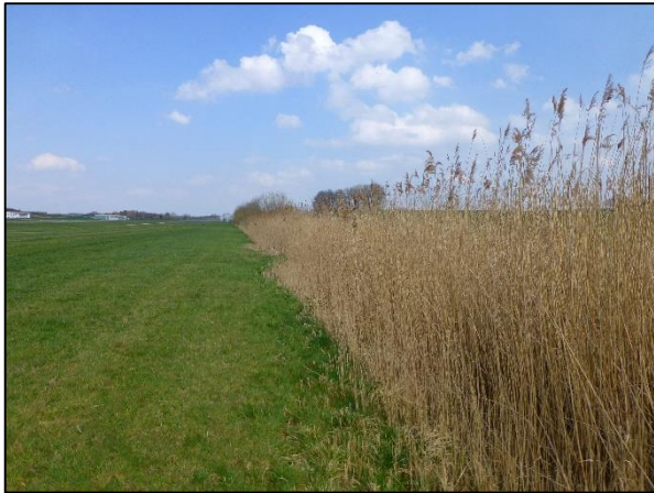
Abb. 3: Röhrichtbestände am Neuweihergrabe