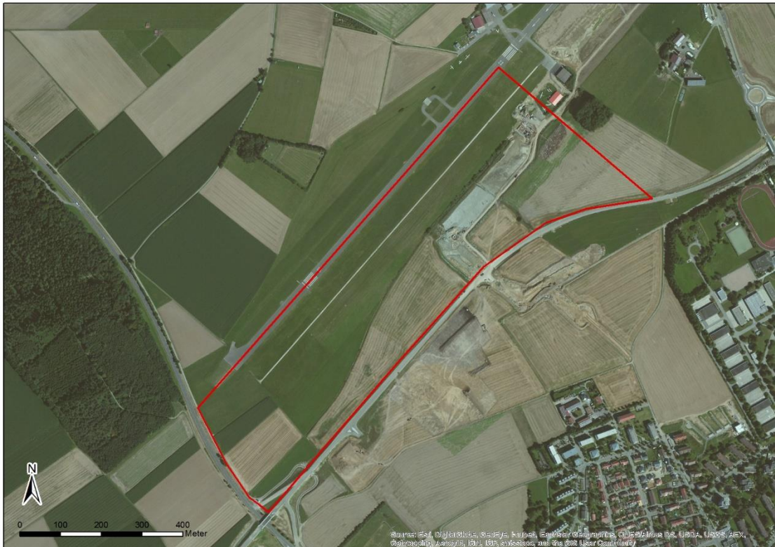
Abb. 1: Untersuchungsgebiet zum geplanten Gewerbegebiet GE2 - Flugplatz

Die Auswahl der planungsrelevanten Arten für den vorliegenden artenschutzrechtlichen Fachbeitrag beschränkt sich vorwiegend auf die gem. § 7 BNatSchG streng geschützten Arten des Anhangs IV der FFH-Richtlinie und die europäischen Vogelarten, d.h. alle potentiell vorkommenden Vogelarten. Für diese Gruppen gelten die Verbotstatbestände des § 44 Abs. 1 BNatSchG in Verbindung mit Art. 12 und 13 der FFH-RL und Art. 5 VS-RL (europäische Vogelarten). Zusätzlich wird in Einzelfällen auf Arten des Zielartenkonzepts Baden-Württemberg eingegangen, welche eine Relevanz für das Planungsgebiet aufweisen bzw. aufweisen könnten.