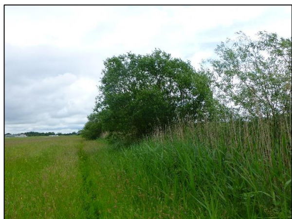
Abb. 8: Neuweihergraben mit Röhricht und Gehölze, Blick Richtung Norden