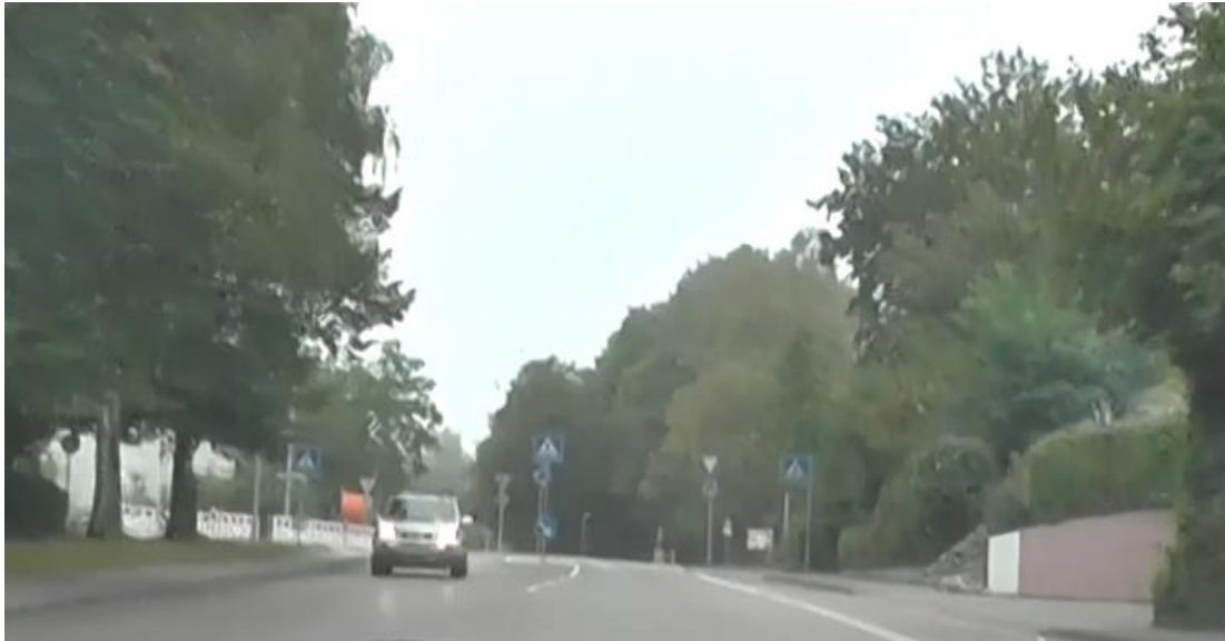
Bild 3: Annäherung an den Mini-KVP auf der Gaisentalstraße von Osten, der Mini-KVP ist nur durch die Beschilderung zu erkennen

Im Zuge der Gaisentalstraße liegt der Mini-KVP auf einer Kuppe und ist bei der Annäherung sehr spät erkennbar.