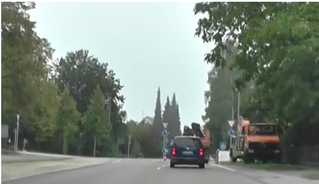
Bild 4: Annäherung an den Mini-KVP auf der Gaisentalstraße von Westen, auch hier ist der Mini-KVP nur durch die Beschilderung zu erkennen