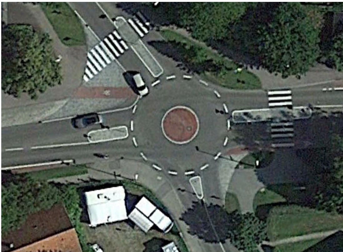
Bild 5: Detailansicht Mini-KVP mit Kreisfahrbahn und Zufahrten, gut zu erkennen die gepflasterten Flächen für die Rechtseinbieger an der Zufahrt Krummer Weg und Grüner Weg

An den Zufahrten Krummer Weg und Grüner Weg ist ein Rechtseinbiegen in die übergeordnete Gaisentalstraße wegen des spitzen Winkels nicht möglich. Hier sind eigene Flächen in Pflaster für das Einbiegen hergestellt.