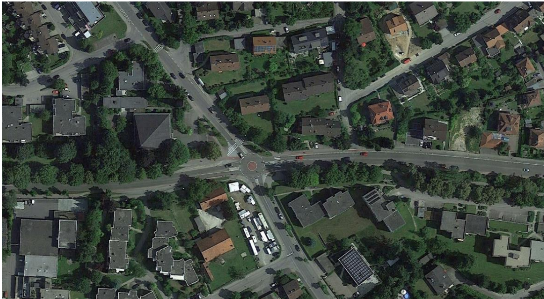
Bild 1: Lage des Mini-Kreisverkehrsplatzes im Nordwesten von Biberach Die Gaisentalstraße verläuft in Bildmitte von links nach rechts, der Krumme Weg mündet von oben ein, der Grüne Weg von unten.

Der Mini-KVP liegt innerhalb geschlossener Ortslage. Die beteiligten Straßenäste laufen relativ spitzwinklig aufeinander zu.