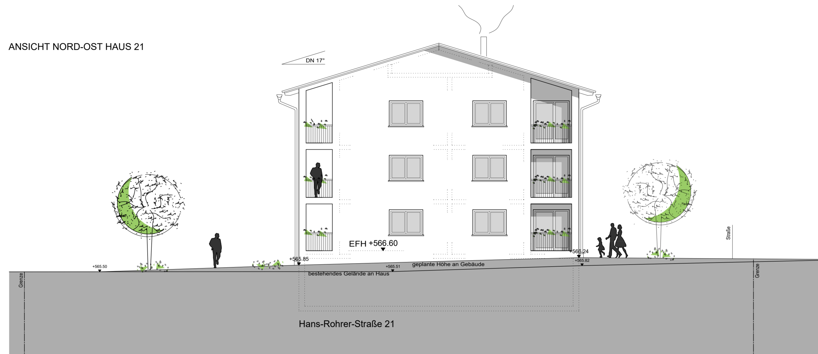
ANSICHT NORD-OST HAUS 21