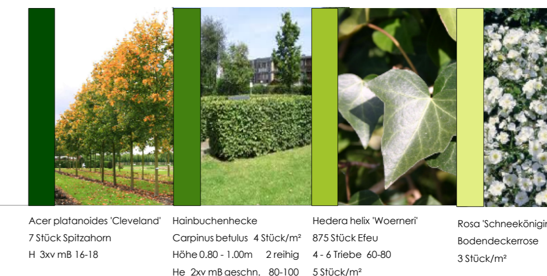
Acer platanoides 'Cleveland' 7 Stück Spitzahorn H 3xv mb 16-18 Hainbuchenhecke Carpinus betulus 4 Stück/m 2 Höhe 0,80 - 1,00m 2-reihig He 2xv mb geschn. 80-100 Hedera helix 'Woerner' 875 Stück Efeu 4 - 6 Triebe 60-80 5 Stück/m 2 Rosa Schneekönigin Bodendeckerrose 3 Stück/m 2