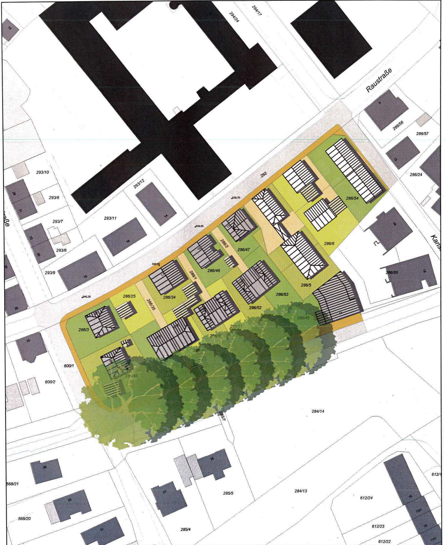
Rahmenplan Karl - Müller - Straße Variante 2 M.: 1 : 1000 Stadtplanungsamt 21.08.2015