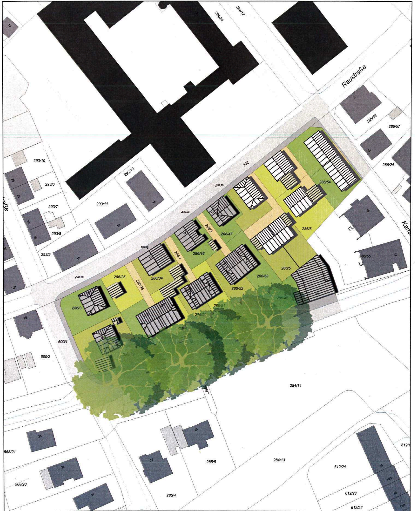
Rahmenplan Karl - Müller - Straße Variante 1 M.: 1 : 1000 Stadtplanungsamt 21.08.2015