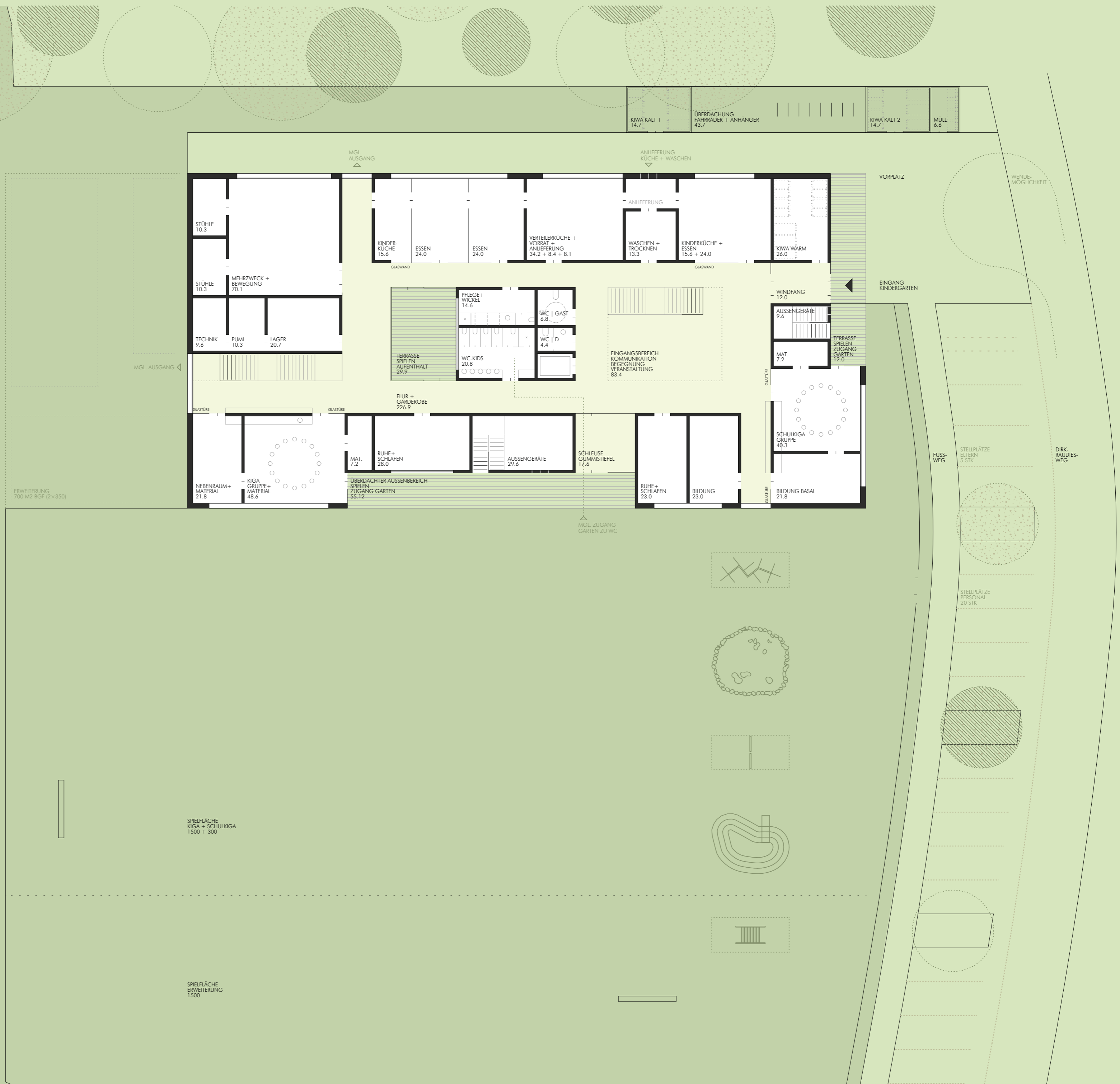
ERDGESCHOSS MIT FREIRAUMGESTALTUNG 1/200