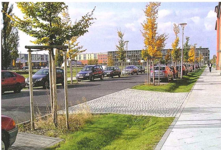
Abb. 4_ Straßenszene mit ungepflegten, verkrauteten Baumringen