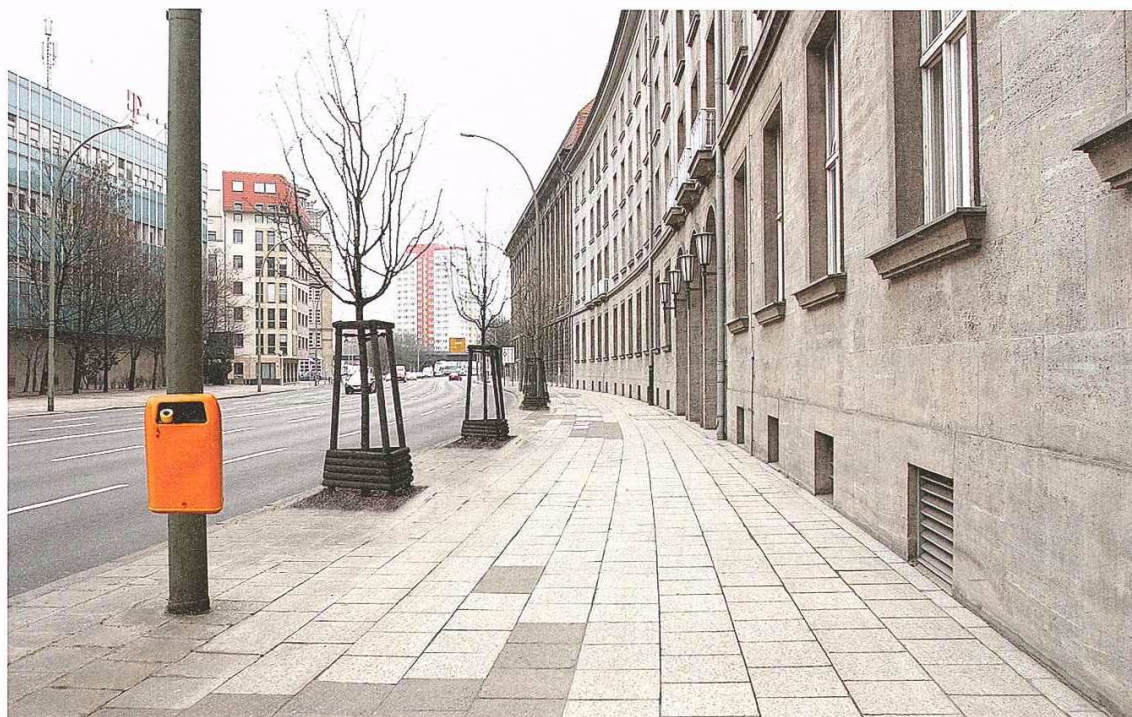
Abb. 2_ Mehrfarbige Vorlage für eine Straßenszene (ohne Verschmutzung)