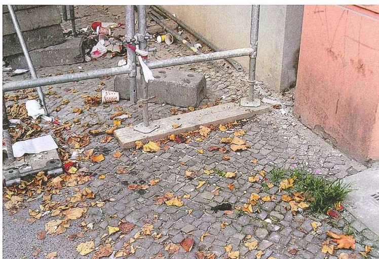
Abb. 6_ Baustelle am Gehweg mit Hundekot, herumliegendem Müll, Unkraut und Laub