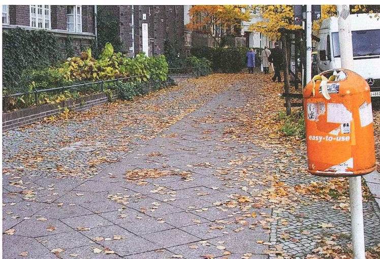
Abb. 5_ Gehweg mit überfülltem und beschmierem Papierkorb, Papier und Laub